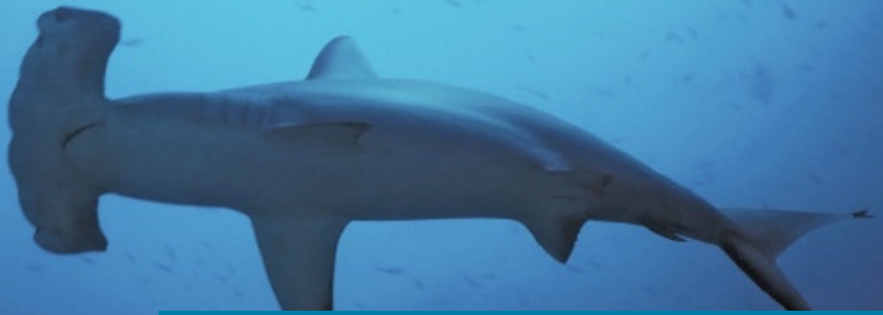
TABELLE 2: PROZENTUALE VERÄNDERUNGEN NACH ZAHL UND BIOMASSE FÜR ALLE BERÜCKSICHTIGTEN BEREICHE IM MITTELMEER