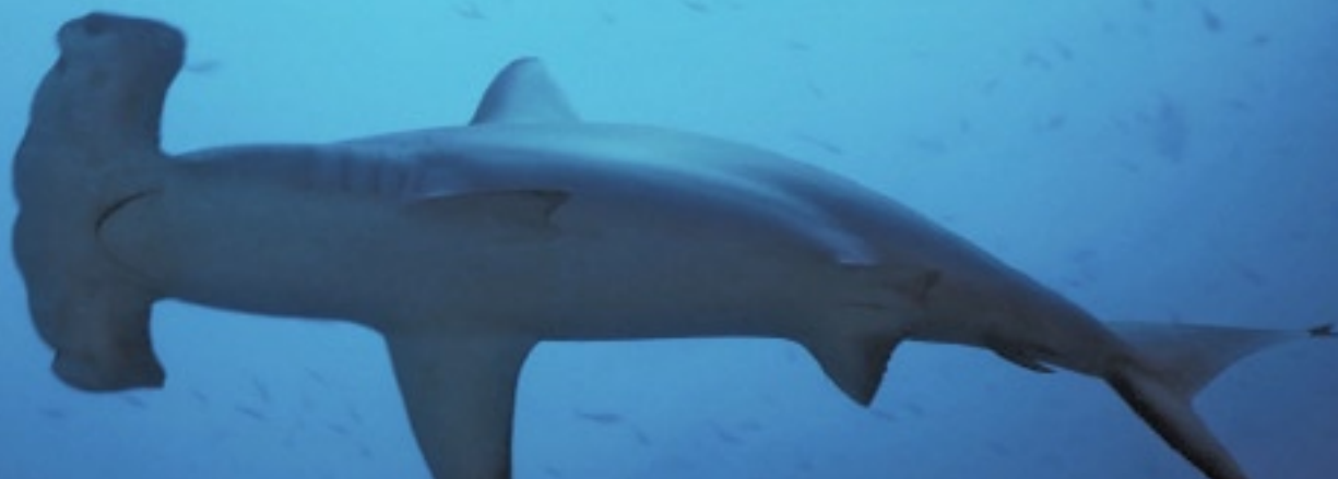
TAVOLA 2: CAMBIAMENTO IN PERCENTUALE NEL TEMPO IN TERMINI DI ABBONDANZA E BIOMASSA IN TUTTI I SETTORI DEL MEDITERRANEO OGGETTO DI STUDIO